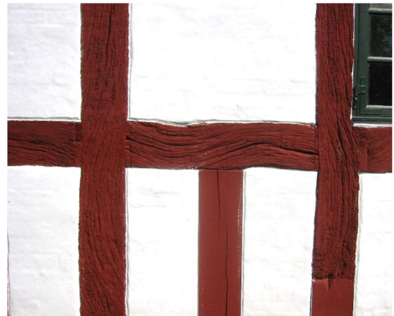
Rigtigt: tryk en skrå fas op mod tømmerets kant