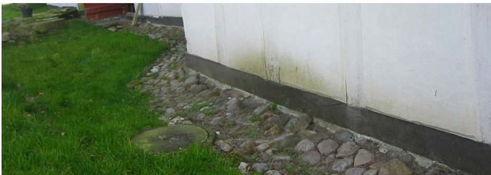
Rigtigt: Pigstenskant langs bindingsværksvæggens 'tagdryp' – men se lige hvad et lille betondæksel kan bevirke af fugt og grønalger på væggen. Det klarer pigstenene – der dog ikke må lægges i beton – meget bedre.