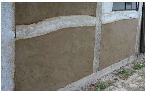
Rigtigt: Behold de gamle lertavl – eller lav nye, hvis de skal udskiftes.