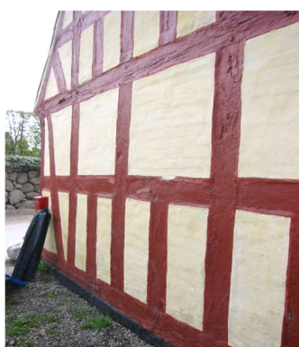
Plastikmaling på træ og tømmer