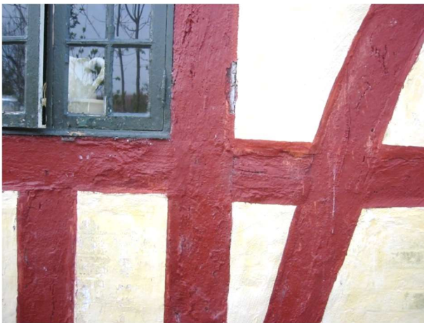
Forkert: Puds hen over bindingsværkstømmeret