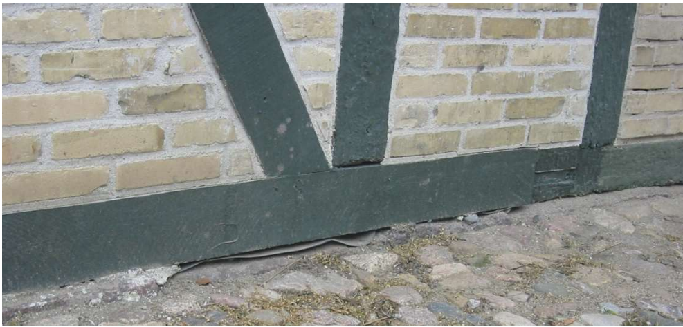
Forkert: Tagpap under fodremmen